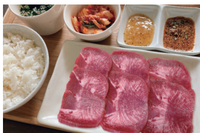
上タン塩焼肉セット