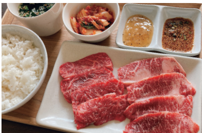
和牛カルビ&ハラミ焼肉セット