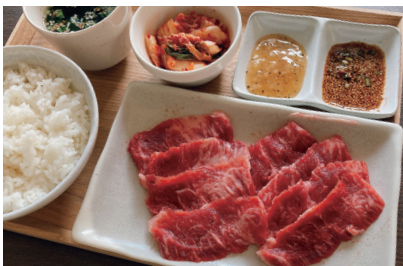
牛カルビ焼肉セット