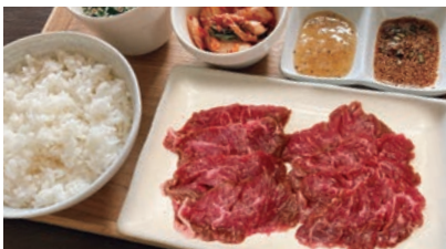
牛ハラミ焼肉セット