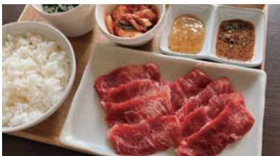
牛カルビ焼肉セット