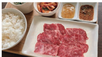
和牛ハラミ焼肉セット