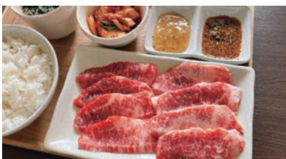
和牛カルビ焼肉セット